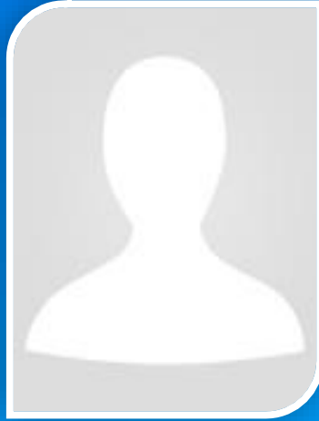
ปลัดเทศบาลตำบลท่าเรือ โทร. ....